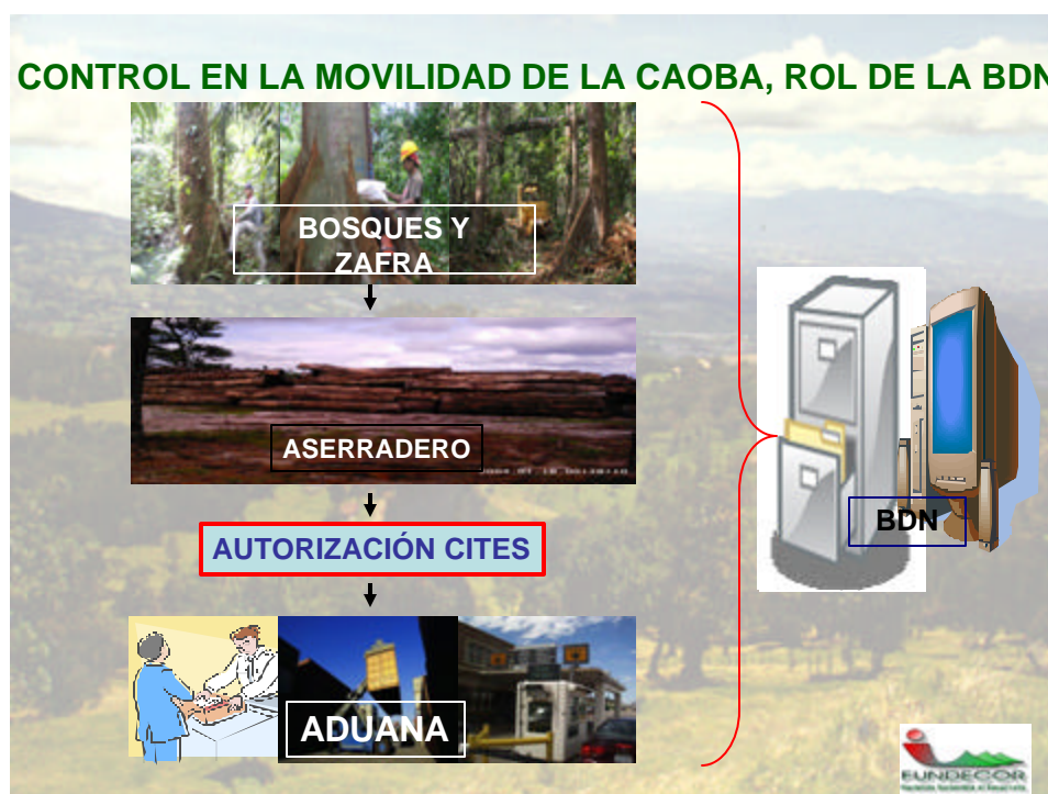
Figura 1. Control de la Producción de Caoba y actualización de la BDN

Cualquier punto del proceso productivo de la Caoba puede y debe ser auditable. Se plantea registrar toda la información relacionada a ingreso de materia prima y salida de producto, de una manera sencilla y que ésta sea remitida a la BDN periódicamente mediante informes internos de control de inventario (con información mínima requerida), que las industrias deben llevar, ver Figura 1.